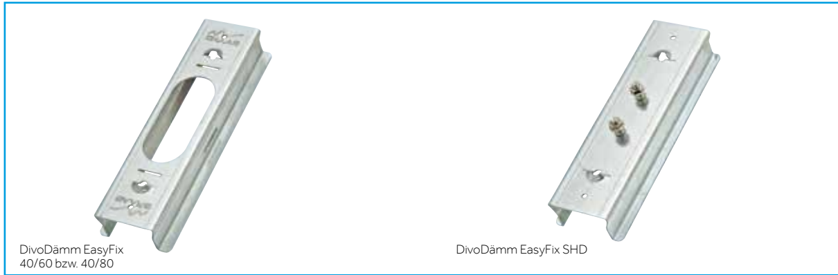
DivoDämm EasyFix 40/60 bzw. 40/80